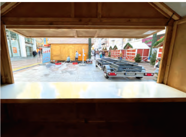
Verkaufstheke und geöffnete Verkaufsclappen von Innen